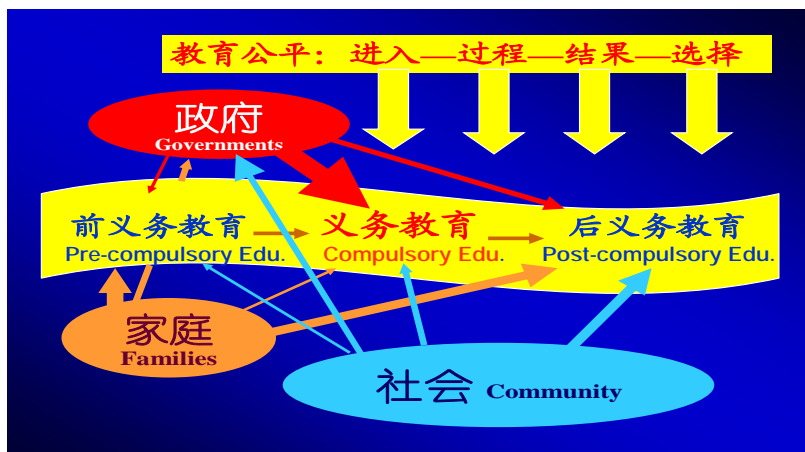
图3 政府、家庭、社会在推进教育公平中的角色

中，政府应将财政性教育经费主要投入在义务教育阶段；提供后义务教育阶段的优质服务；家庭则应将重点投入到前义务教育阶段和后义务教育阶段；社会在这一过程中，要支持政府的相关政策与行为，并支持后义务教育水平的提高，具体参见下图。