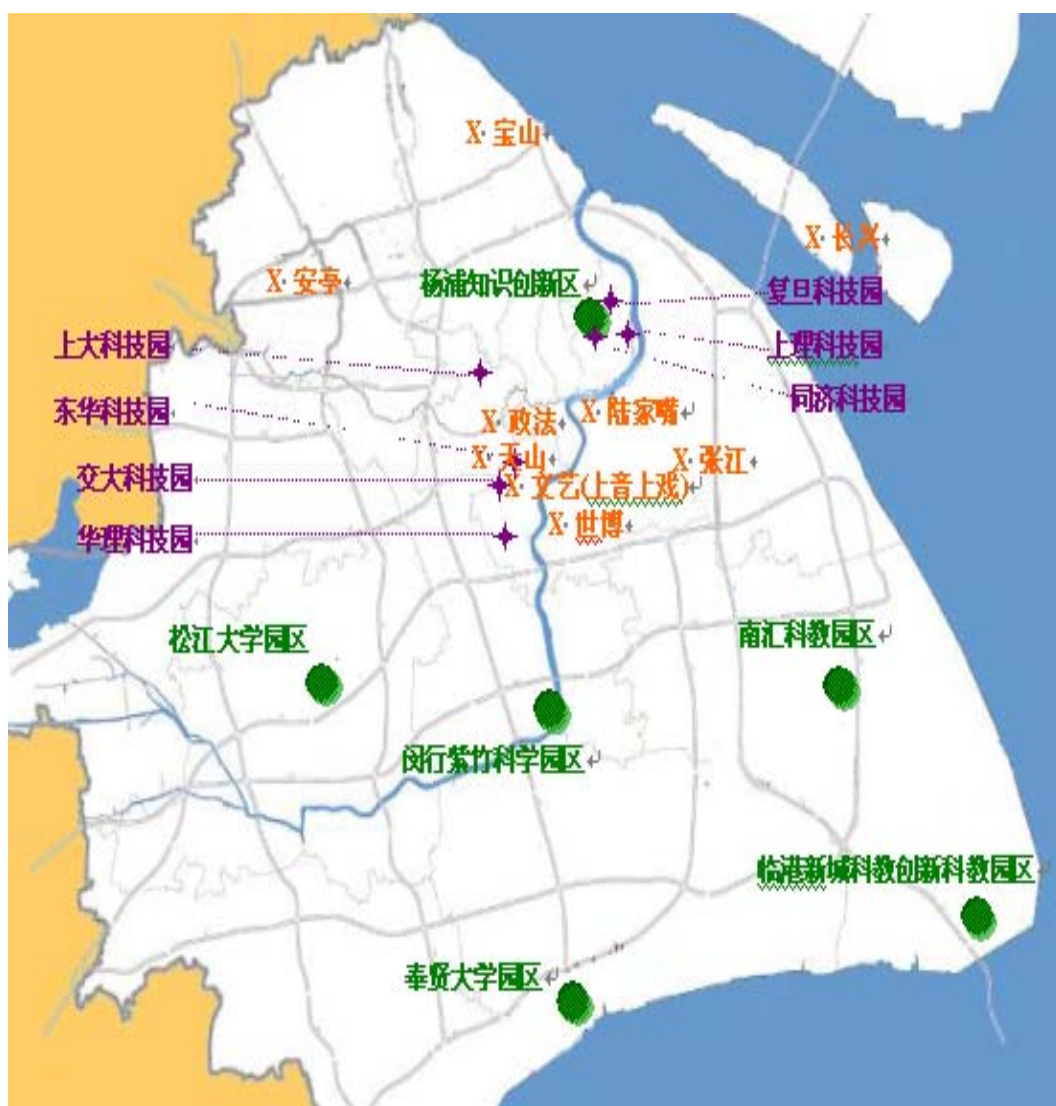
图 1 三区联动发展中的高校布局体系

能力、优化升级产业结构、转变增长方式以及创造和谐社会的战略需要出发，深化和丰富现有“2+2”三区联动发展体系的内涵，明确设计和规划临港新城、奉贤海湾以及若干重点产业发展区域的高校布局及三区联动发展目标定位，在全市形成一批大学、园区、社区互为依托、互相推动、实现共赢的创新发展增长点。