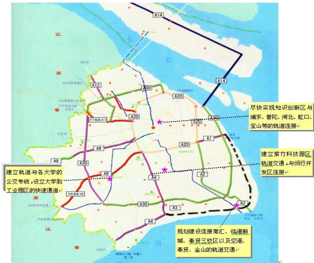
图 4 围绕三区联动和城市创新发展增设部分轨道交通

——在部分大学校区之间、学校之间、学校与大企业之间、大学与研发基地或各类园区之间，建立专用快速公交线路，为三区联动发展创造便于合作、联动的条件。