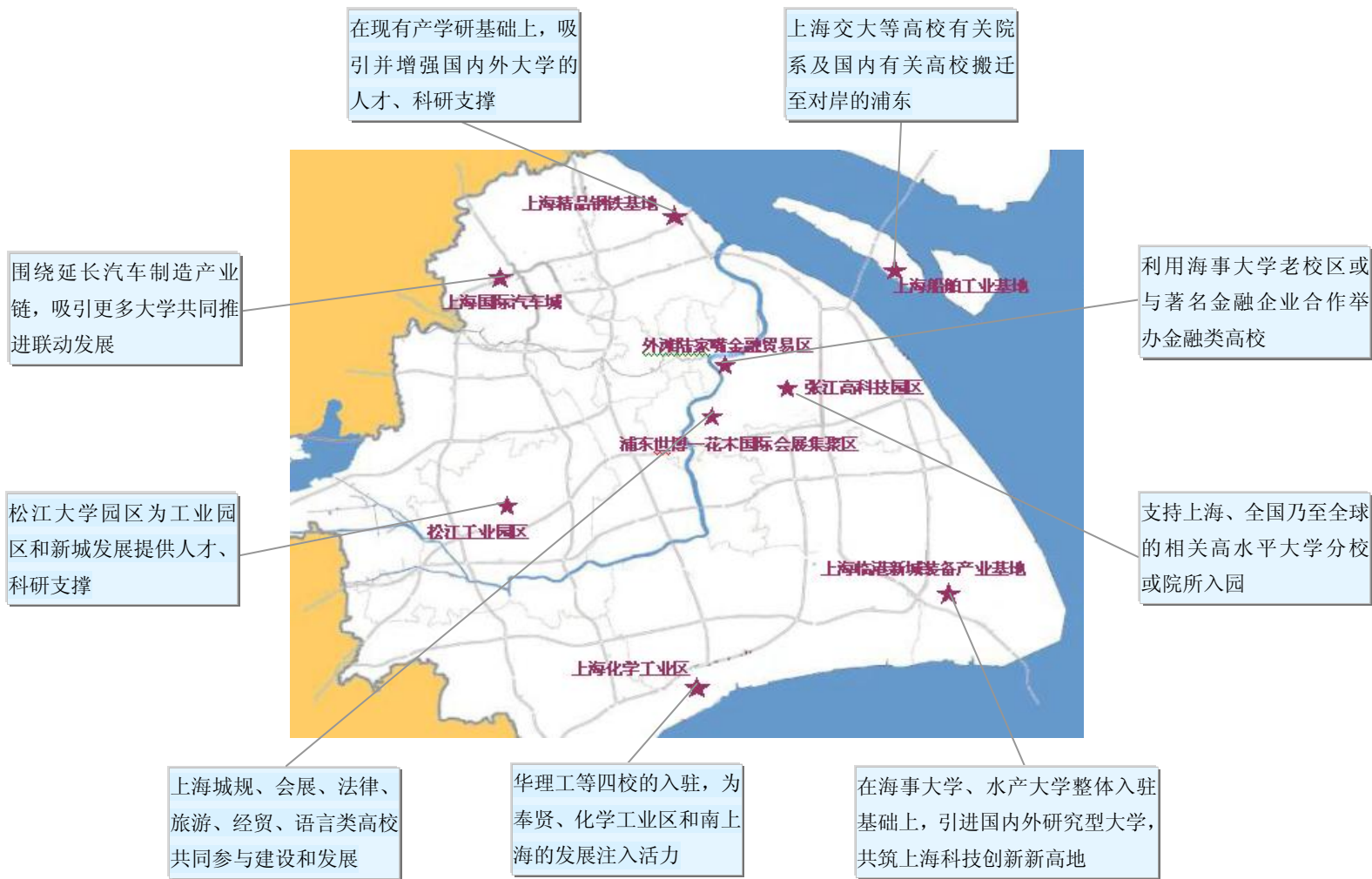
图 2 城市产业布局中的三区联动发展联盟